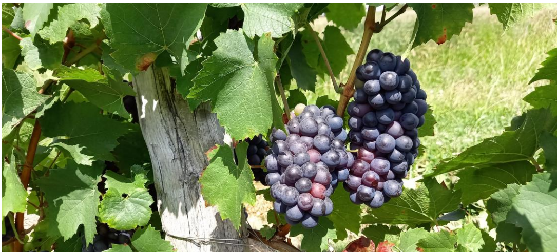
Photo prise le 31 août à Saint-Vérand

* Le réseau Maturation signe sa 30 ème campagne avec le millésime 2021. Dès le début de la véraison, deux fois par semaine, près de 200 vignerons réalisent bénévolement des prélèvements sur plus de 230 parcelles et envoient les résultats à la chambre d'agriculture du Rhône qui coordonne et anime ce réseau. Les données ainsi récoltées sont compilées et analysées puis mises à disposition des vignerons et de la profession : un outil de suivi et d'aide à la décision précieux et unique dans son mode de fonctionnement.