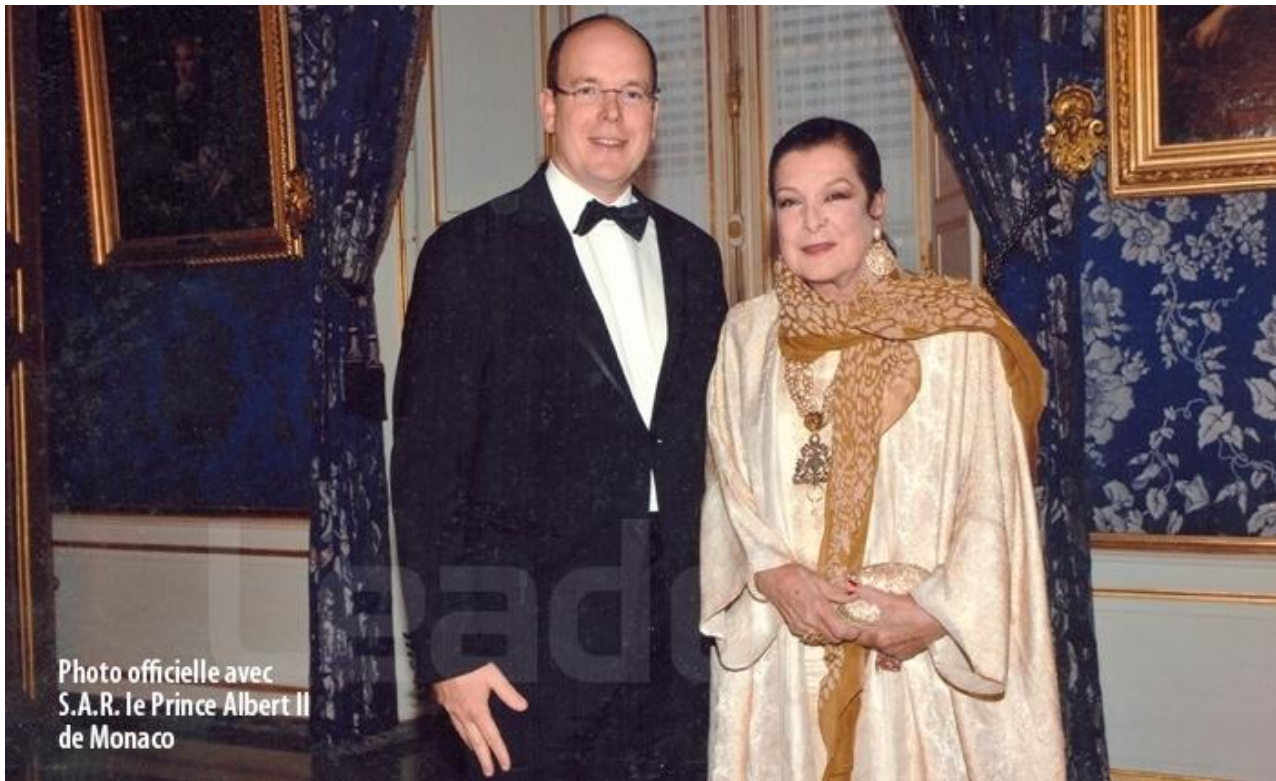
Photo officielle avec S.A.R. le Prince Albert II de Monaco