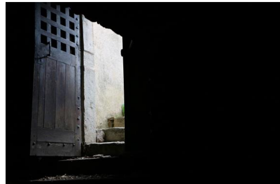
Nos Caves du 12 e siècle