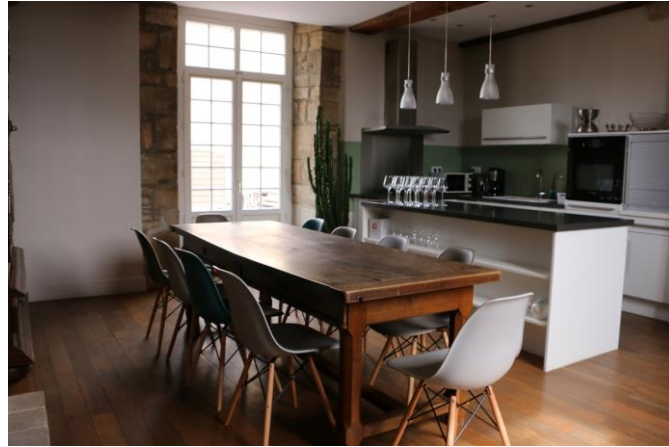
Cuisine pour le Déjeuner