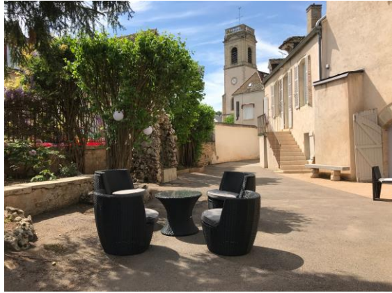
Le Wine Bar « Jefferson's Club »