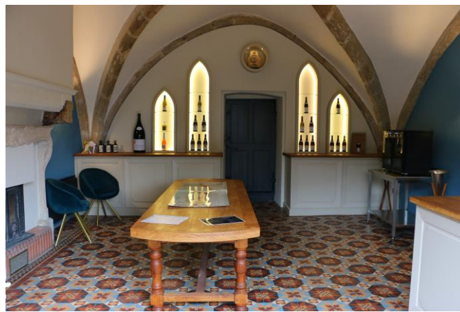
Caveau de dégustation, notre Chapelle du 12 e siècle