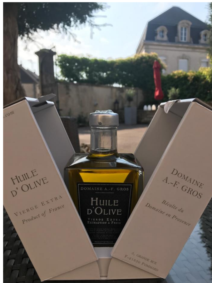
L'huile d'Olive du Domaine produite sur nos oliviers dans le Vaucluse