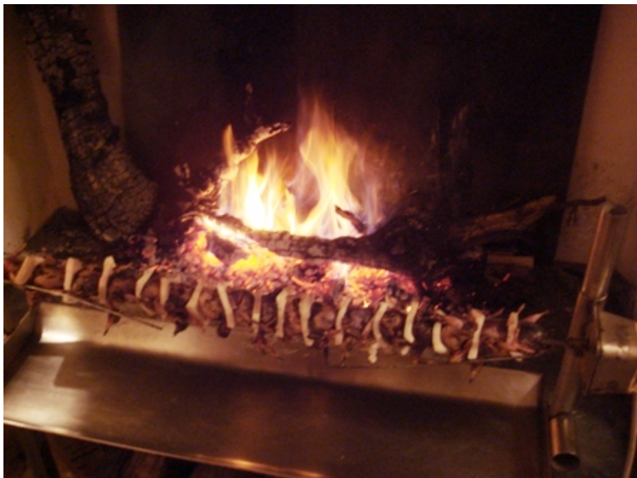
Pendant l'apéritif, les grives rôissent.