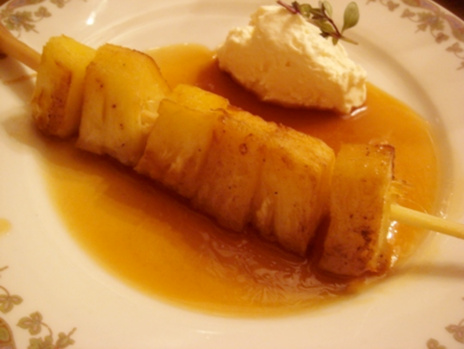
Délicieuse terrine, et l'ananas sur branche de citronnelle préparé par nos amis hollandais.