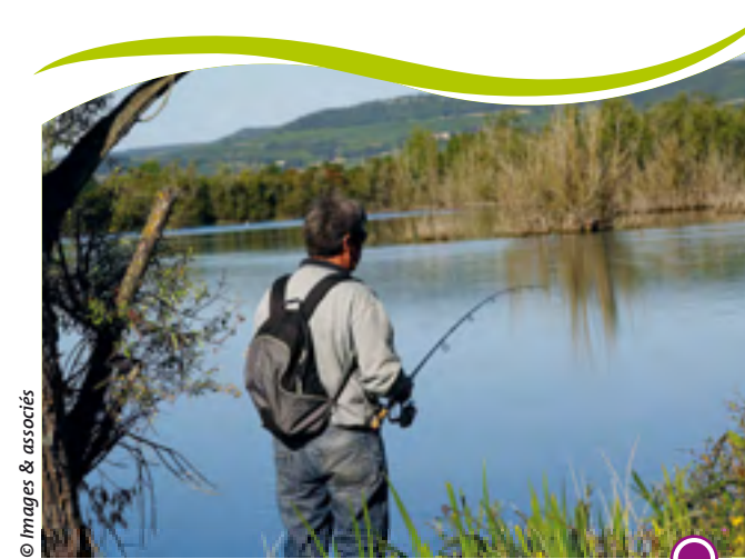
PÊCHE AUX ÉTANGS DE MERCEUIL FISHING IN THE MERCEUIL PONDS