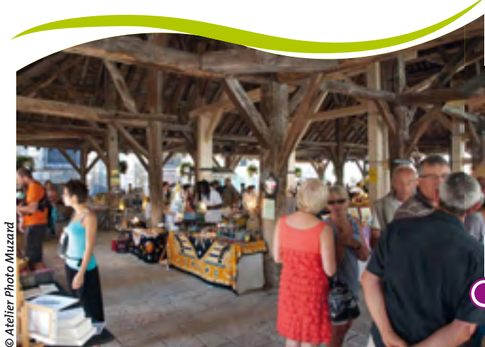
HALLES MÉDIÉVALES DE NOLAY - XIV ÈME SIÈCLE THE XIV TH CENTURY MARKET HALL