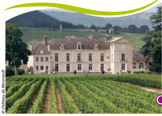
DOMAINE DU CHÂTEAU DE MEURSAULT CHATEAU DE MEURSAULT VINEYARD