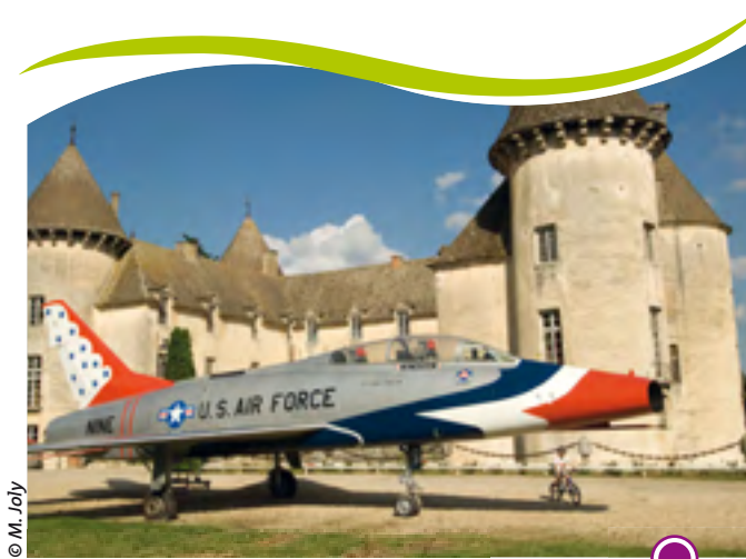
CHÂTEAU DE SAVIGNY-LES-BEAUNE