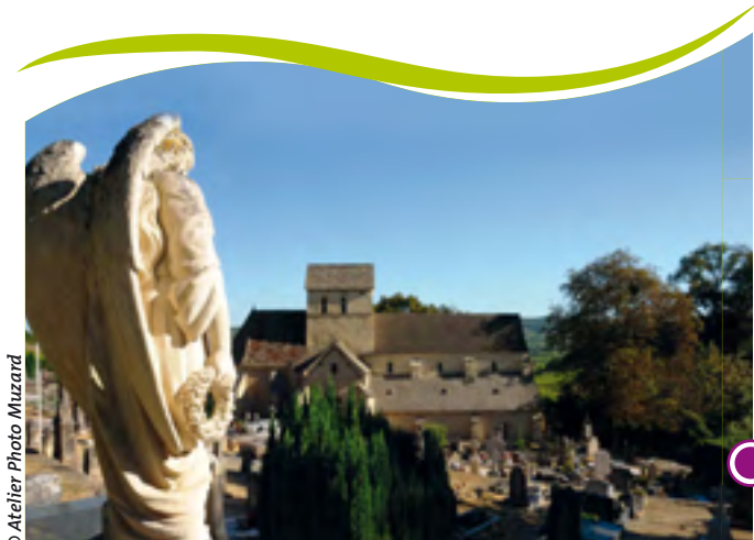
EGLISE ST-JEAN DE NAROSSE - XIII ÈME SIÈCLE