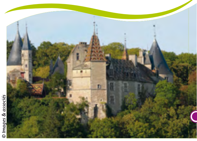
CHÂTEAU DE LA ROCHEPOT - XV ÈME SIÈCLE