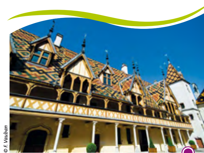
HÔTEL DIEU DE BEAUNE (HOSPICES DE BEAUNE)