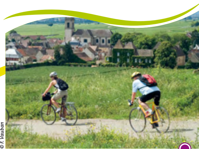
VÉLOROUTE BEAUNE-SANTENAY THE VINEYARD TRAIL