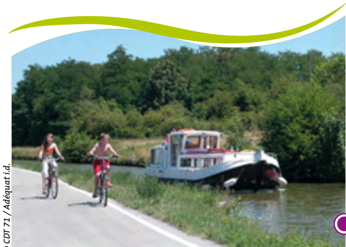
CANAL DU CENTRE A CHAGNY