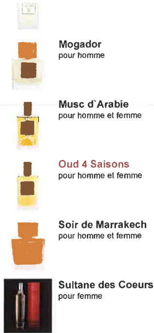
Mogador pour homme