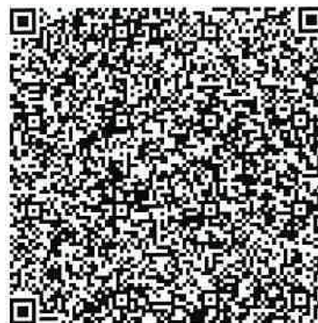
Certificat COVID numérique UE

Nom(s) de famille et prénom(s) Name, Surname(s) and forename(s)