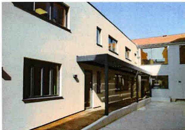
Extérieur de LBA